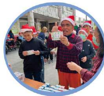
▲ 「HAPPY!聖誕遊」聖誕節活動