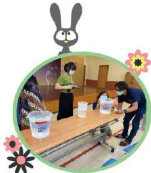
▲在職訓練「感染管控」課程