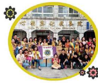
▲ 南風獅子會蒞院關懷